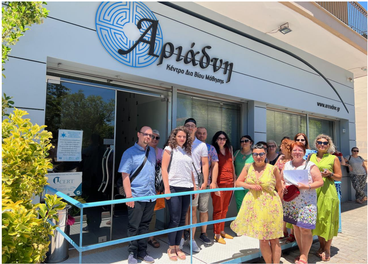
Areadne Lifelong Learning Centre – Kalamata, Grecia